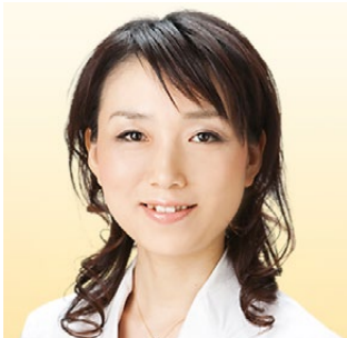
桑島内科医院 副院長 新宿溝口クリニック 栄養療法医師